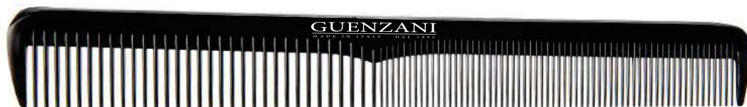
Cod. 436 • Pettine accademia Disponibile anche nel colore bianco aggiungendo al codice /B