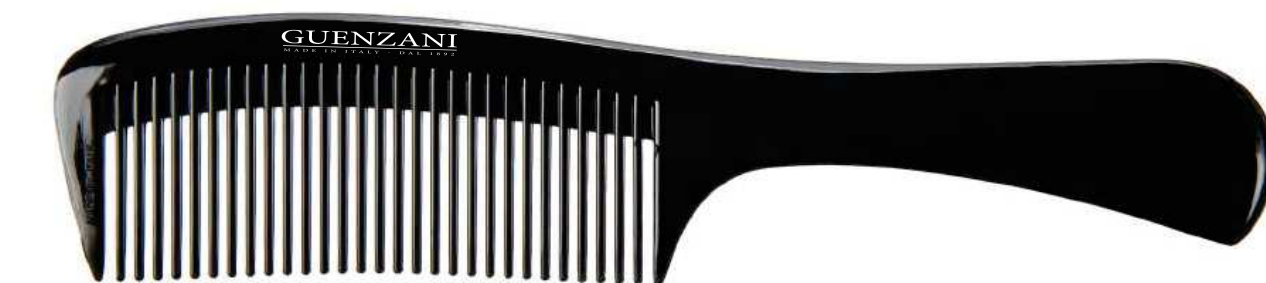
Cod. 447 • Pettine manico sottile

Disponibile anche nel colore bianco aggiungendo al codice /B