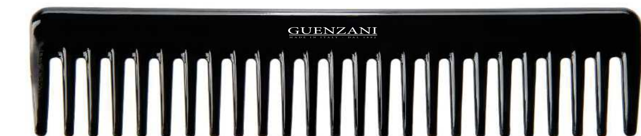
Cod. 449 • Pettine afro

Disponibile anche nel colore bianco aggiungendo al codice /B