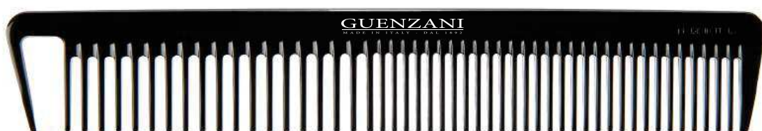
Cod. 431 • Pettine accademia con prendiciocca Disponibile anche nel colore bianco aggiungendo al codice /B