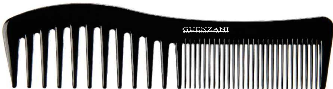
Cod. 430 • Pettine afro/fitto

Disponibile anche nel colore bianco aggiungendo al codice /B