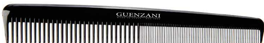
Cod. 438 • Pettine sfumatura Disponibile anche nel colore bianco aggiungendo al codice /B