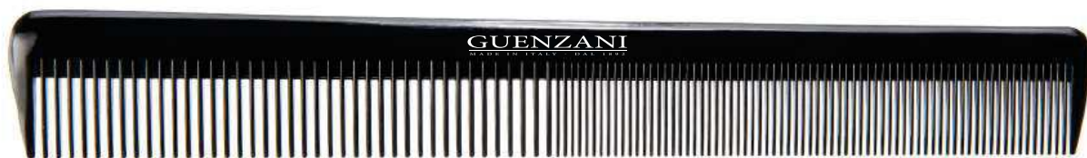
Cod. 437 • Pettine accademia lungo Disponibile anche nel colore bianco aggiungendo al codice /B