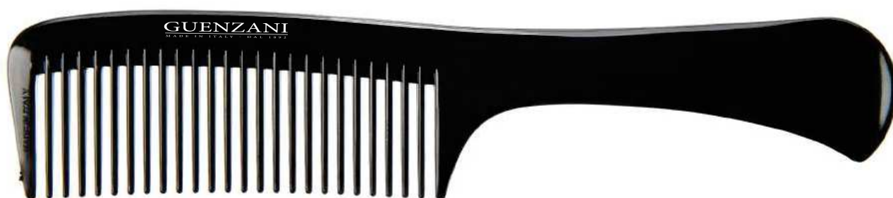
Cod. 443 • Pettine manico grosso

Disponibile anche nel colore bianco aggiungendo al codice /B